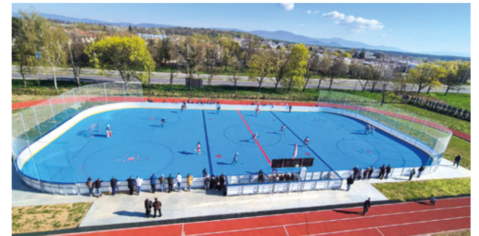
Nové školské športovisko s hokejbalovým ihriskom

Dôležitú úlohu zohrali aj ekologické riešenia. Strechy boli zateplené minerálnou vlnou a doplnené o extenzívne zelené strechy. Pôvodné okná a dvere nahradili nové s izolačným trojsklom, zateplený bol aj obvodový plášť budovy. Modernizáciou prešli elektrické rozvody a inštalovalo sa úsporné LED osvetlenie. Vonkajšie žalúzie chránia triedy pred prehrievaním počas letných mesiacov. Na ohrev vody slúžia solárne panely, pričom v telocvični a školskej jedálni bol zavedený systém rekuperácie s podporou tepelného čerpadla. Súčasťou projektu sú aj dažďové záhrady, ktoré pomáhajú zadržiavať dažďovú vodu