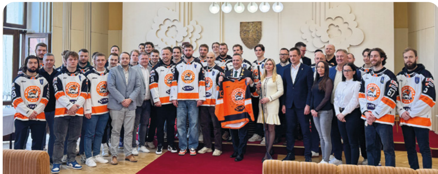
Zástupcovia mesta hokejistov slávnostne prijali v obradnej sieni