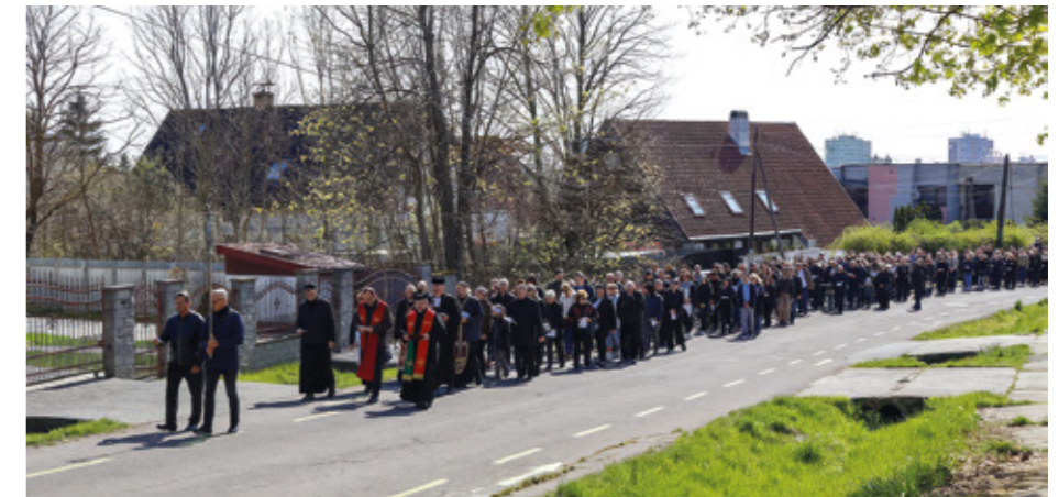
Ekumenický pašiový sprievod smeroval až k cintorínu na Bielej hore

Centrum mesta sa počas sviatkov premenilo na farebnú veľkonočnú scenériu. Ulice zdobili kraslice, jarné dekorácie