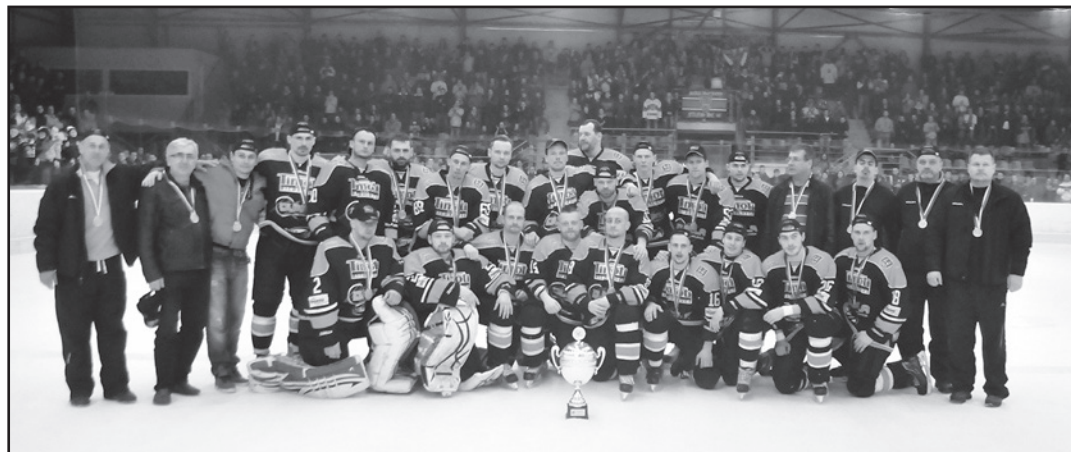
Strieborní chlapci zo sezóny 2013/14