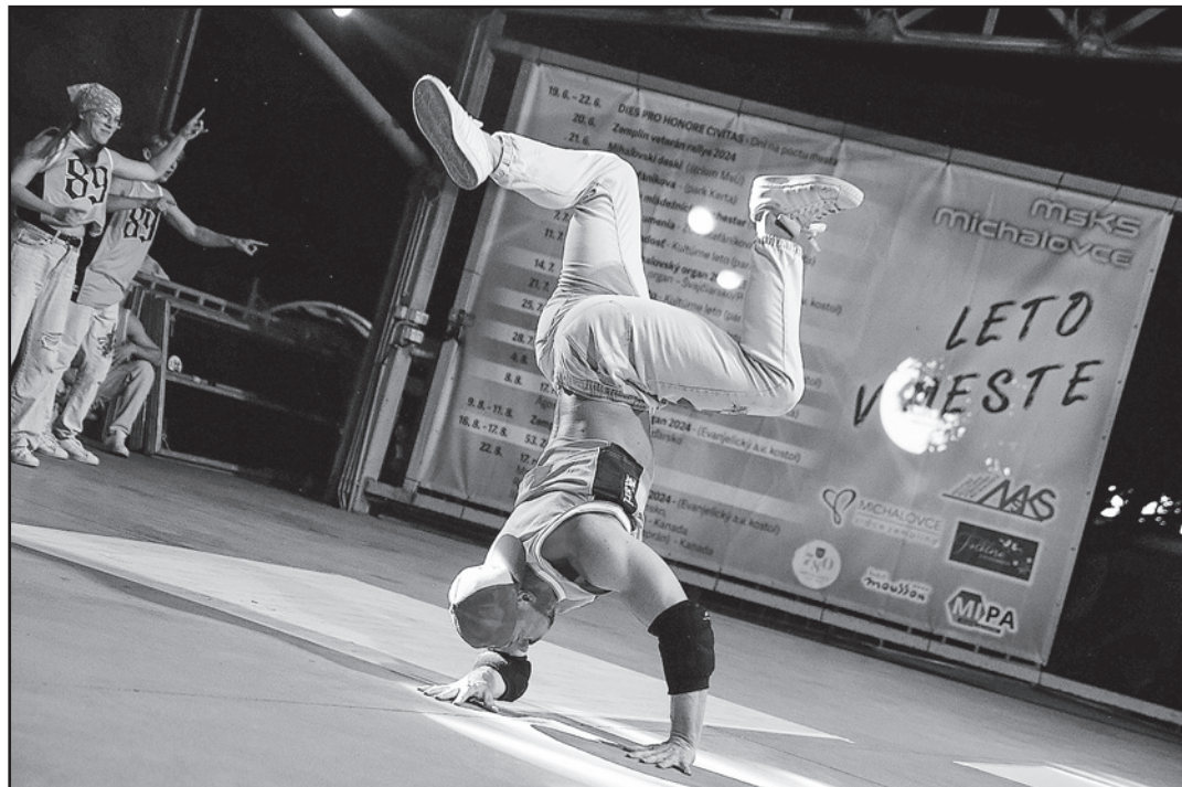
Old School Brothers roztancovali v piatok večer zaplnené námestie

Na tribúne pri mestskom úrade sa na pódiu vystriedalo viacero