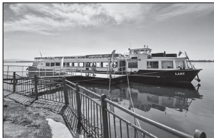
Lod' prišla z Prahy na Slovensko cez päť krajín