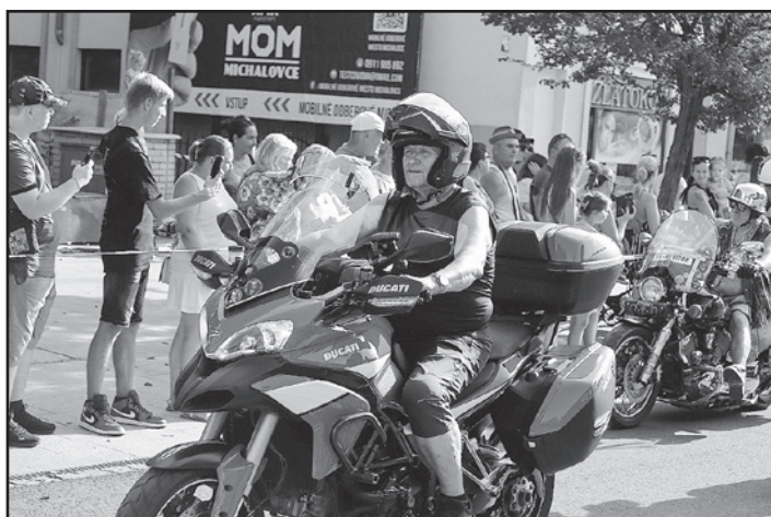
Stovky motoriek prešli námestím počas spanilej jazdy