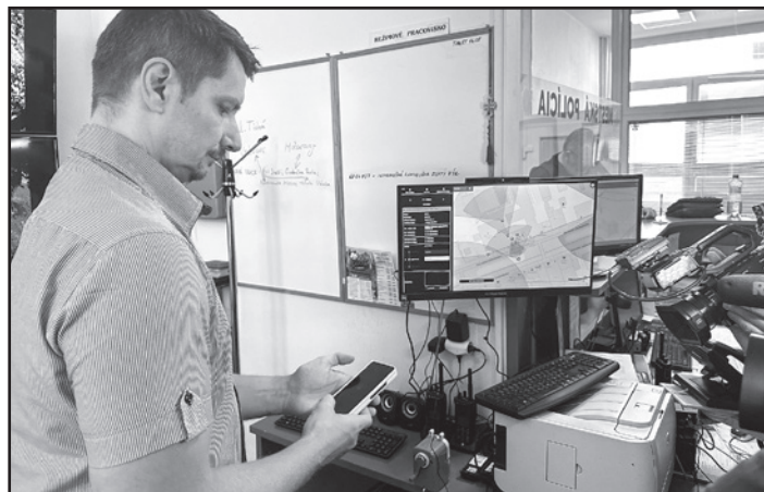
Testovanie aplikácie Bezpečné mesto

Technológia využívaná týmito detektormi zvuku je unikátna v tom, že neurónová sieť, ktorá vykonáva spracovanie a klasifikáciu zvuku, beží priamo na procesore umiestnenom v zariadení. Vďaka čomu nie je potrebné budovať infraštruktúru. Všetky procesy sú zároveň v súlade so všeobecným nariadením o ochra-