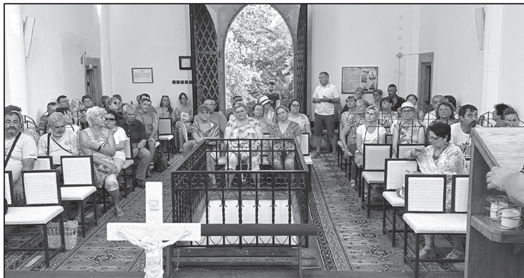
Účastníci mohli navštíviť výnimočne aj interiér kaplnky na Hrádku

Ďalšie Špacirki po varošu sa konali druhý júlový piatok, tentokrát v lokalite Hrádok, ktorá je tak trochu zahalená rúskom tajomstva. V stredovekú tu stál