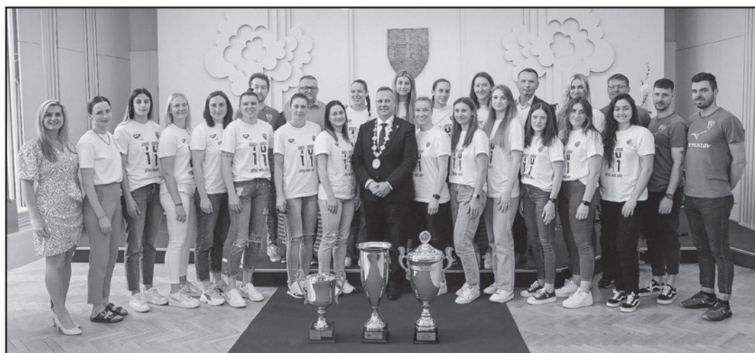
Primátor zablahoževal hráčkam i realizačnému tímu k historicky najúspešnejšej sezóne

Takmer 2000 divákov vytvorilo žltomodrým pekelnú kulisu v očakávaní, že na vlastné oči uvidia historický triumf Iuventy. Do posledného miesta zaplnená hala hmlala naše dievčatá od začiatku až do konca, ale súperky boli takmer po celý čas na koni. V úvodnej štvrthodine sa tímy ešte striedali vo vedení. Iuventa po od-