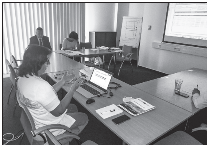
Stretnutie v Budapešti s partnerom projektu z mesta Nyírbátor

Rizikový trend poklesu zrážok, suché horúce počasie a zvyšujúca sa intenzita efektu tepelného ostrova iniciovala spoluprácu mesta Michalovce s mestom Nyírbátor zameranú na implementáciu pilotných prvkov vodozadržných opatrení, ktoré pomôžu ozdraviť nielen klímu, ale aj nepriamo ekonomiku regiónov. Veľká časť centra mesta ako aj areály mestských budov a škôl sú vydláždené, resp. pokryté nepriepustným povrchom, zeleň umiestnená bezprostredne v blízkosti týchto plôch v lete vysychá, voda pri dažďoch odteká do verejnej kanalizačnej siete. Rovnako pri všetkých mestských komunikáciách dažďová voda odteká do kanalizácie, avšak pri privalových dažďoch nepostačuje kapacita kanalizačných odtokov a voda zaplavuje nepriepustné plochy. Manažment dažďovej vody v bytových domoch, ale aj v budovách vo vlastníctve mesta – školy, škôlky, zariadenia sociálnych služieb a pod., bol pri ich výstavbe technologicky riešený prevažne vnútornými zvodmi, čo značne obmedzuje dodatočné oddelenie dažďových vôd, tie sa bez svojho využitia dostávajú spolu so splaškami do kanalizácie. Územie mesta sa postupne vysušuje.