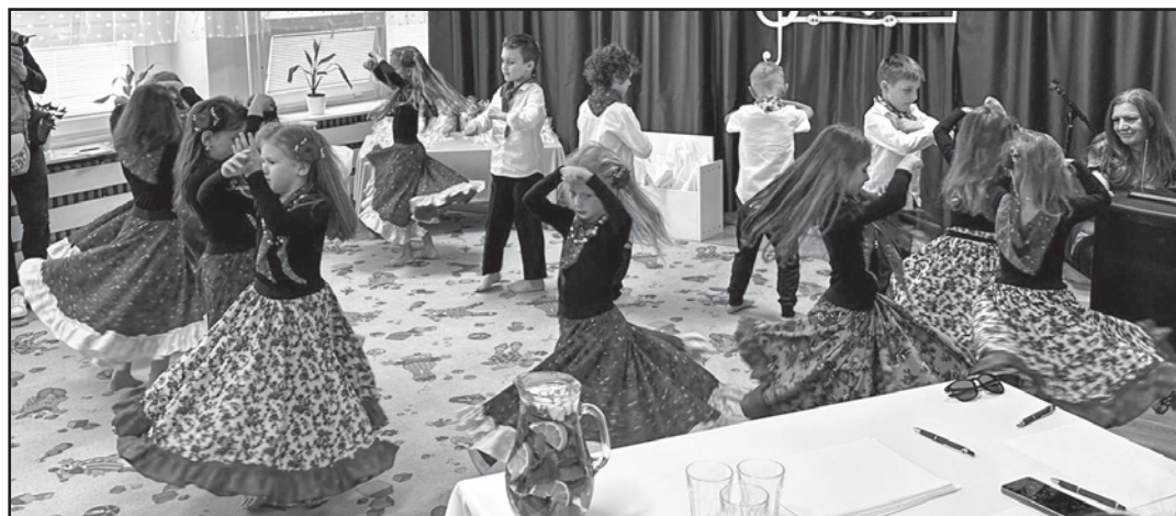
Úvodné tanečné vystúpenie detí z Materskej školy na Školskej ulici

Deti súťažia v dvoch kategóriách – sólo spev ľudových piesní a spev detskej piesne. Tí, ktorí si trúfajú, môžu v druhej kategórii siahnúť aj po piesni modernej, ktorá je pre deti zaujímavá, ale náročná. V oboch kategóriách sa hodnotí výber piesne, intonácia, celkový prejav i vhodné oblečenie. Vzťah k regiónu Zemplín je prvoradý, čím sa u detí umocňuje aj ich vlastenectvo a hrdosť na náš krásny región.