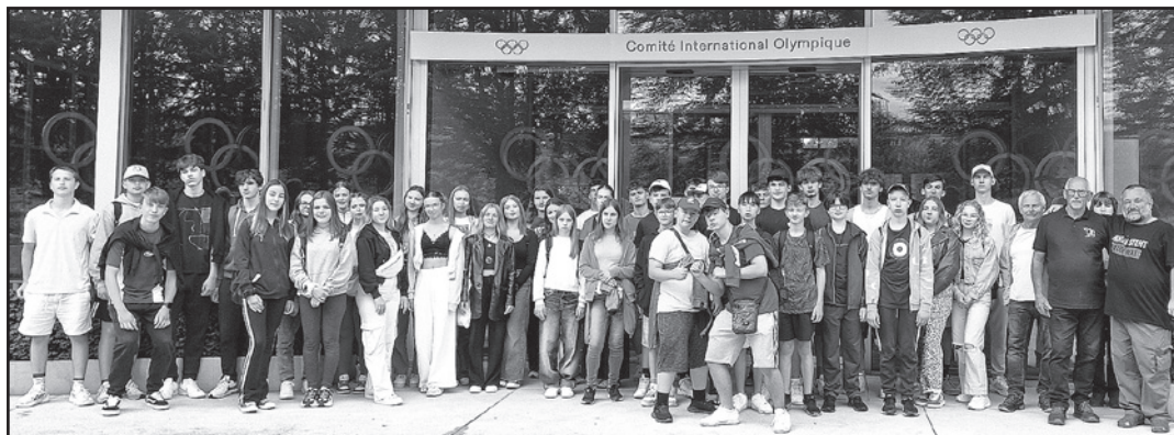
Žiaci ZŠ T. J. Moussona a študenti Gymnázia pred sídlom Medzinárodného olympijského výboru v Lausanne

Výdatné raňajky a ľubozvučná francúzština nás naladila na prehliadku Olympijského múzea v hlavnom meste olympizmu, ležiacoho na brehu Ženevského jazera. Na promenáde Ouchy sme sa od-fotografovali a vydali sa na stúpanie po schodoch pripomínajúcich