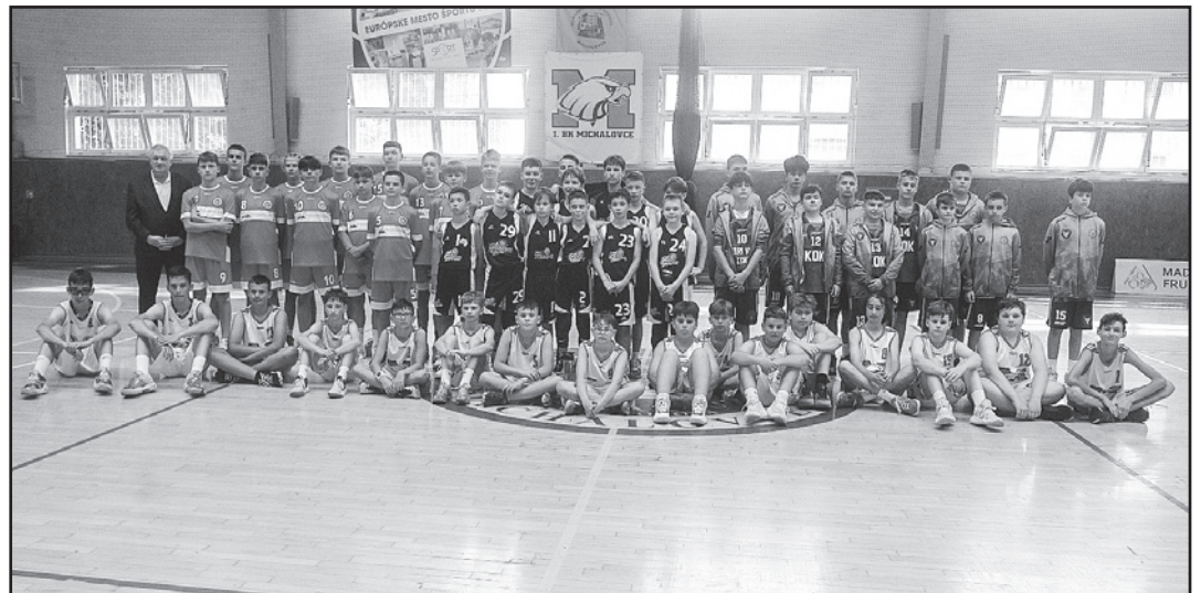
Na turnaji sa stretli hráči zo štyroch krajín

Turnaj štyroch krajín (Turnaj krajín V4) napísal začiatkom júna svoju 20. kapitolu. Basketbalové podujatie sa pravidelne uskutočňuje už dvadsať rokov v Michalovciach a v mestách Przemysl v Poľsku, Eger v Maďarsku a zúčastnili sa ho aj ďalšie družstvá z Ukrajiny, Čiech a Slovenska. Toto športové podujatie patrí k prvým na Slovensku, kde sa začali stretávať v rôznych kolektívnych športoch krajiny V4.