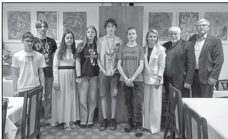
Vítané družstvo ZŠ, Švermova 6

www.tvmistral.sk , na Facebooku a na YouTube (Redakcia Mistral), vo vysielaní partnerskej televízie TV ZEMPLÍN – v sieti Magio (Telekom) a Orange TV.