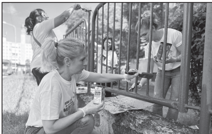
Zamestnanci mestského úradu vymaľovali plot na ZŠ, Moskovská ulica

Medzi dobrovoľníkmi nemohli chýbať zamestnanci Mestského úradu Michalovce, ktorí obnovili náter oploštenia Základnej školy na Moskovskej ulici. Ďalšia osemčlenná skupina sa venovala skrásleniu exteriéru Komunitného centra na Mlynskej ulici. Vysadili tam okrasné kvety a stromčeky, vymaľovali staré pneumatiky aj vstupnú bránu. Ruku k dielu priložili a ku krajskému mestu tak prispeli aj členovia Miestnej občianskej a poriadkovej služby, ktorí sa zamerali na odstraňovanie čiernych skládok v piatich lokalitách: na Ul. staničnej, Ul. pri mlyne, Ul. Š. Fidlíka, v Parku študentov a medzi garážami na Ul. okružnej. Zamestnanci firmy Unomedical a Tatrabanke strávili deň s klientmi Michalovského domova seniorov, pre ktorých pripravili rôzne individuálne aj skupinové aktivity. Opakovane sa do dobrovoľníckej akcie zapojili aj zamestnanci Technických a zá-