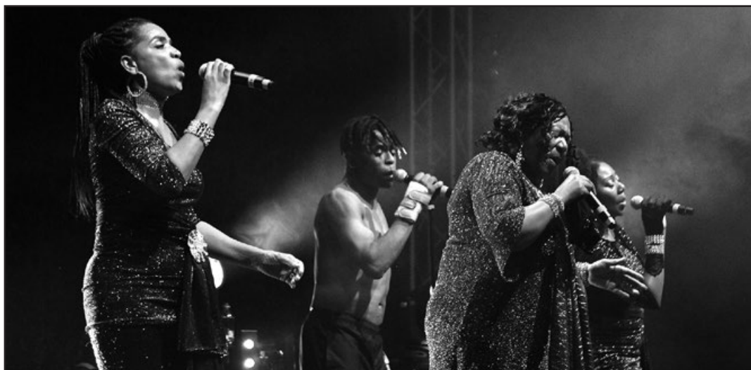
V sobotu 10. februára sa v Chemkostav Aréne v Michalovciach uskutočnil koncert Legendy Oldies. V programe sa predstavila celosvetovo známa populárna skupina Boney M so skvelou speváčkou Liz Mitchell. Michalovčania si tak mohli vypočuť, zaspievať si a zabaviť sa na známych hitoch, ako Rivers of Babylon, Rasputin, či Daddy Cool. Ich predskokanmi bola skupina Modern Talking (reloaded).