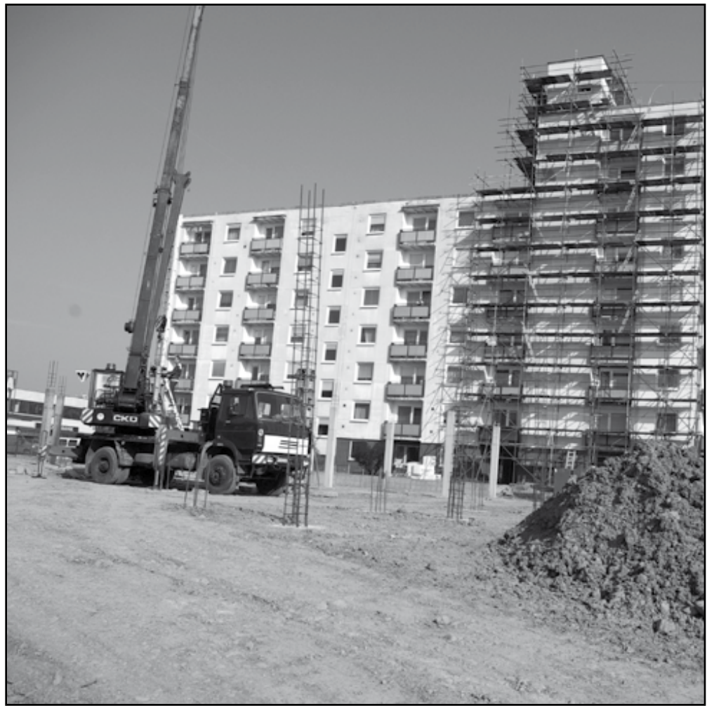
V auguste sa začala prístavba a rekonštrukcia Zariadenia pre seniorov na Hollého ulici. Po ukončení prác sa skvalitní život obyvateľov tohto zariadenia a zvýši sa jeho kapacita.

So samotnou realizáciou výstavby začala firma Chemkostav a.s. Michalovce v auguste tohto roka. Zazmluvnená doba prác je 22 mesiacov. S ohľadom na vekovú kategóriu klientely zariadenia a ruch na stavbe mesto jednalo s dodávateľom o možnosti skrátenia termínu. Ak sa nevykrytú nepredvídanú udalosť, zhotoviteľ plánuje práce ukončiť do 17 mesiacov. I. Palečková