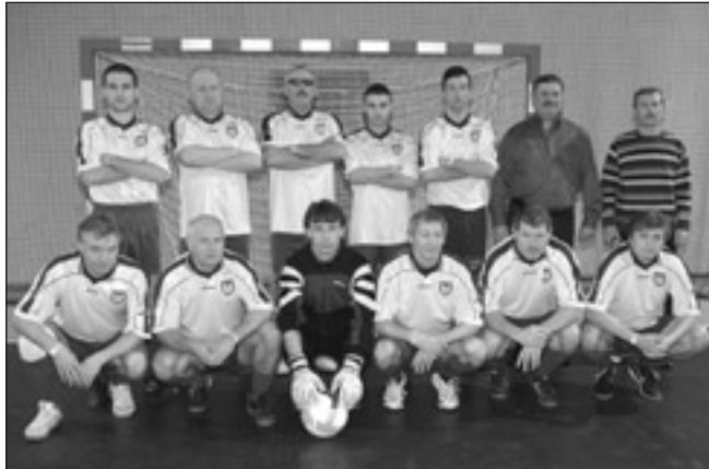
Za domáce družstvo Primátor team Michalovce hrali bývalí hráči FK Zemplín, ale aj dvaja reprezentanti súčasného klubu.

27. 2. 2010, 7. 00 hod. Info: Viliam Kohút, č. tel. 0908362137