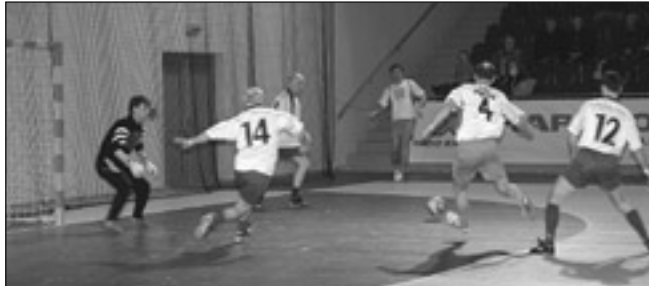
Domáci Primátor team Michalovce podľahol Primátor teamu Prešov 1:2.

Výsledky turnaja: Primátor team Michalovce-Interhouse Košice 0:1, Fiso Sobrance-Teko Košice 0:3, Primátor team Prešov-Harsco