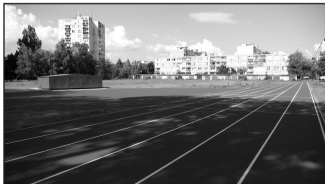
V areáli IV. základnej školy sa buduje nová atletická dráha

Srdčne Vás pozývame na Zemplínsky jarmok a Zemplínske slávnosti v dňoch 15. - 17. augusta 2008.