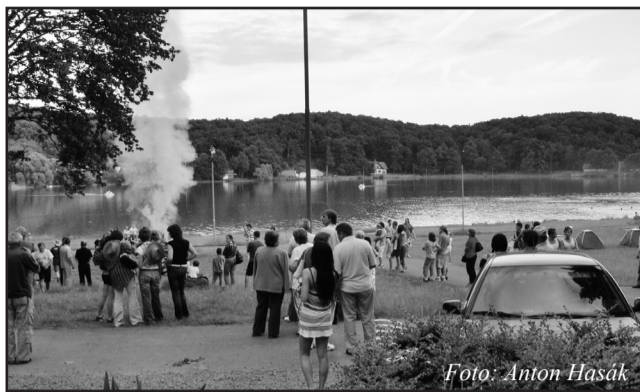
Letný zraz turistov pri Vinianskom jazere.