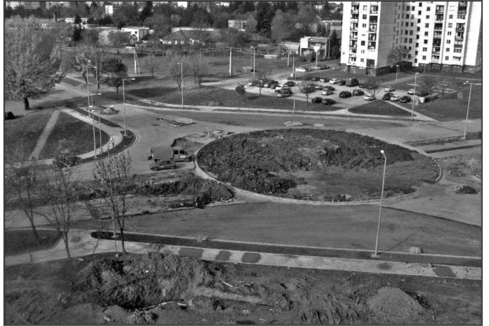
V týchto dňoch naplno pokračujú stavebné práce na kruhovom objazde na križovatke ulíc Hollého, Moskovská a Okružná. Investorm je mesto Michalovce. Zhotoviteľ - Inžinierske stavby, a.s. Košice chcú termín ukončenia stavby (19. novembra 2007) v zmysle uzavretej zmluvy o dielo dodržať.