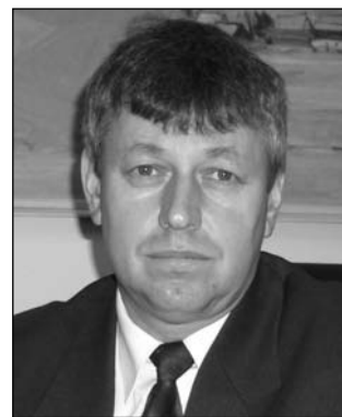
brá, hlavne s odborom školstva.

Na Slovensko v najbližších rokoch prídu nemalé čiastky z Európskych fondov. Ako je pripravená škola na čerpanie týchto prostriedkov v rámci rôznych projektov?