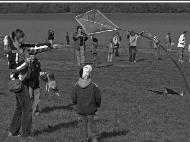
V prvú októbrovú nedeľu zorganizovalo občianske združenie Návraty na Zemplínskej širave ošmu michalovskú šarkaniádu. Z vydatého popoludnia sa tešili rodičia, no najmä deti.

12. októbra - 2. novembra - galéria MsKS Výstava obrazov - Július Král'