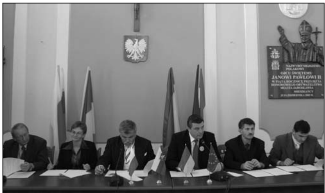
Zástupcovia Michaloviec a mesta Jaroslaw pri podpise Memoranda o porozumení.

riaditeľ NsP Š. Kukuru v Michalovciach, n.o.