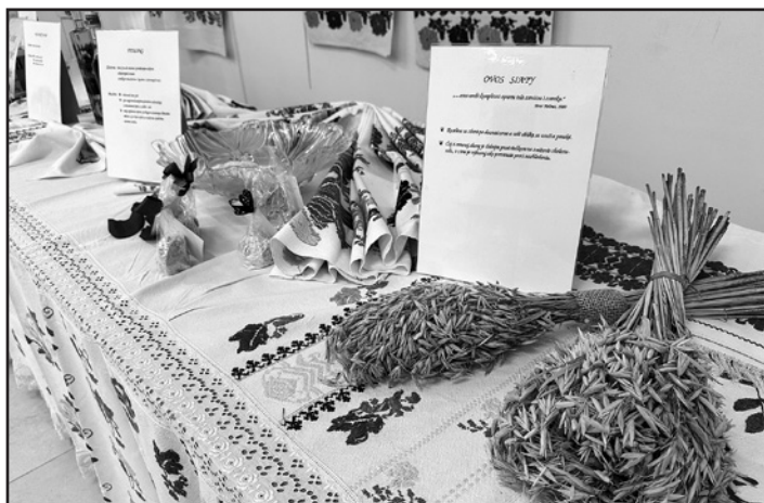
Čaj z ovsenej slamy je dobrý na zníženie cholesterolu aj ako prevencia proti nachladeniu