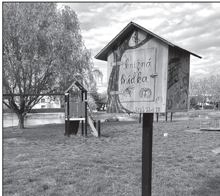
Knižnú búdku pri jazierku Baňa skrášlili žiaci SZUŠ Talent-Um

Úvodnú várku kníh do knižných domčekov poskytlo Mestské kultúrne stredisko Michalovce z fondu antikvariátu. Ktokoľvek, kto má záujem, si môže knihu bezplatne požičať a po prečítaní ju vrátiť, alebo vymeniť za inú – môže vložiť do búdky vlastnú knihu, ktorú už nebude čítať a chce ju posunúť ďalším čitateľom. Knihy