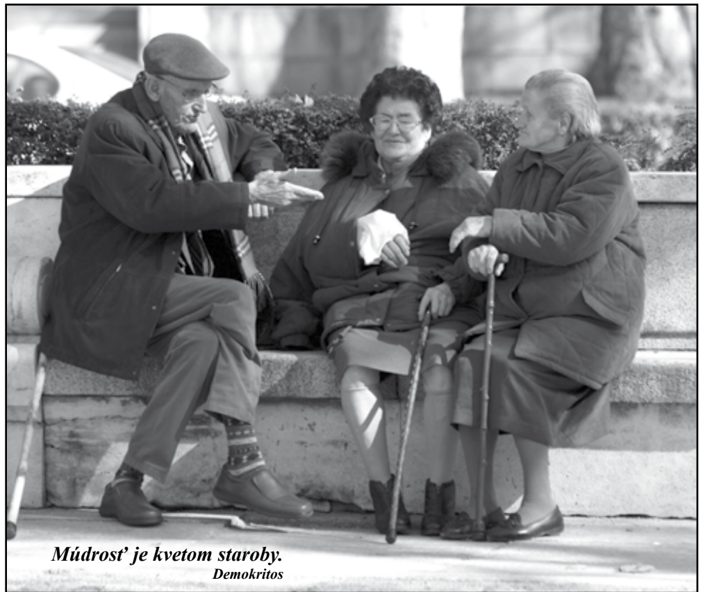
Múdrost' je kvetom staroby. Demokritos