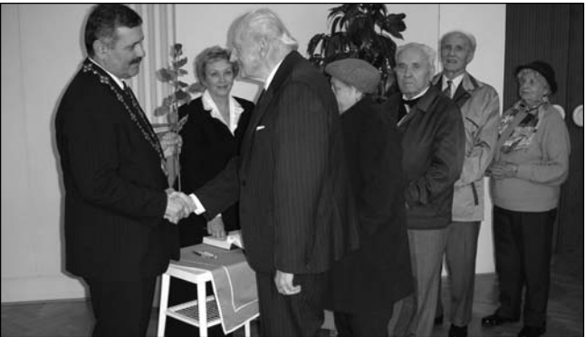
Pol tisícky dôchodcov jubilantov nad 70 rokov pozval primátor do MsÚ v rámci mesiaca úcty k starším.