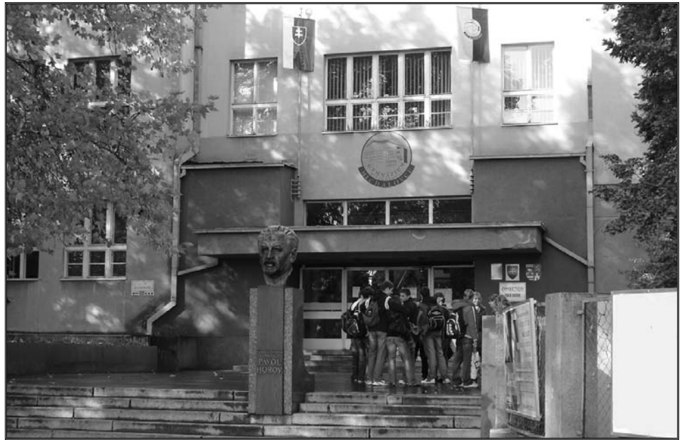
Gymnázium P. Horova sa môže pochváliť s vyše 60-členným profesorským zborom a v jeho priestoroch študuje 994 žiakov.